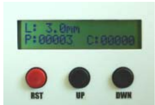
リード長を0.1mm単位で設定できる液晶画面