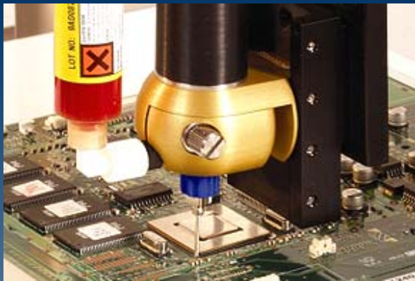
アンダーフィルの塗布