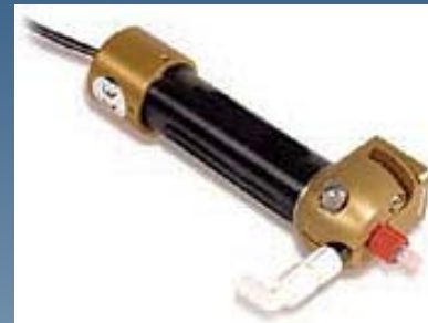
ロータリーバルブ ・TS5000DMP