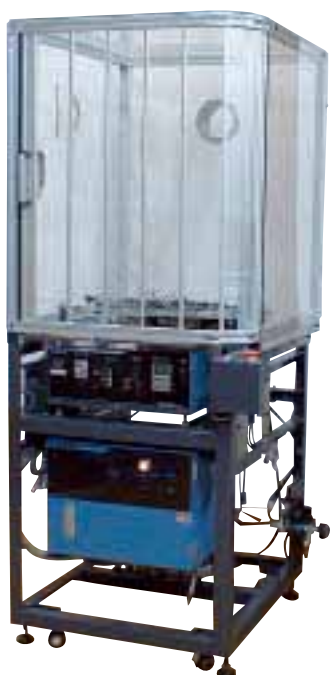
TOP-560B スライドシャッター仕様