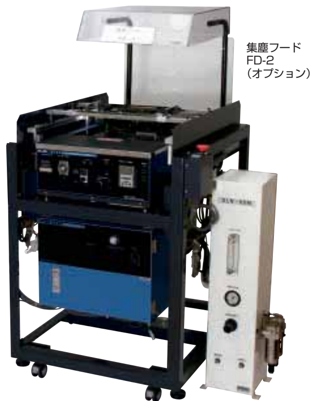
集塵フード FD-2 (オプション)